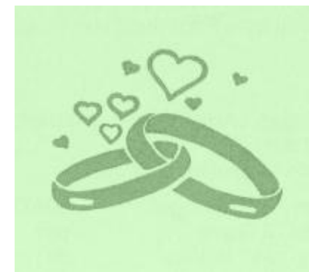
Merkblatt für Trauungen